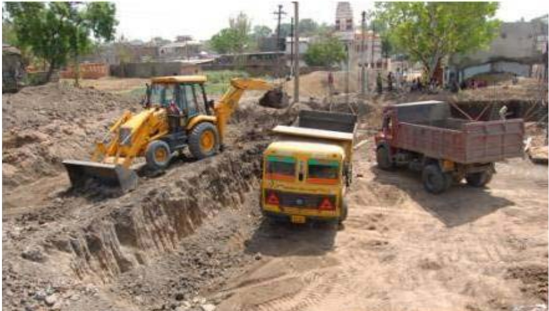
जेएनएनयूआरएम के अंतर्गत उज्जैन में शहरी गरीबों हेतु निर्माणाधीन आवास