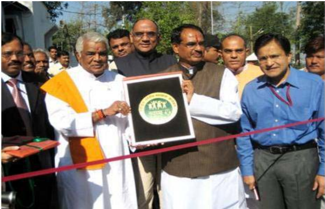
नगरीय समग्र स्वच्छता अभियान का प्रारम्भ