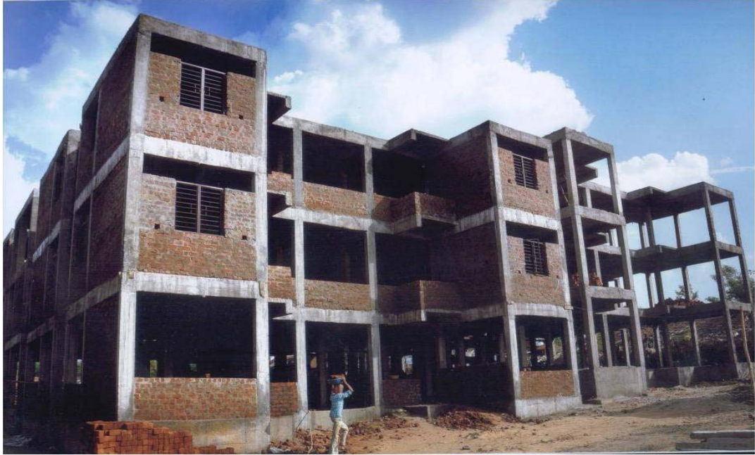
आईएचएसडीपी के अंतर्गत होशंगाबाद में चल रहे आवास निर्माण कार्य