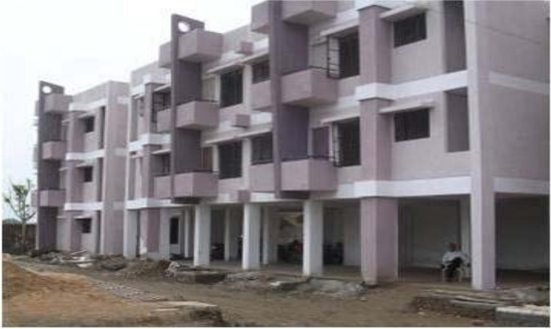
जेएनएनयूआरएम के अंतर्गत इंदौर में शहरी गरीबों हेतु निर्मित आवास