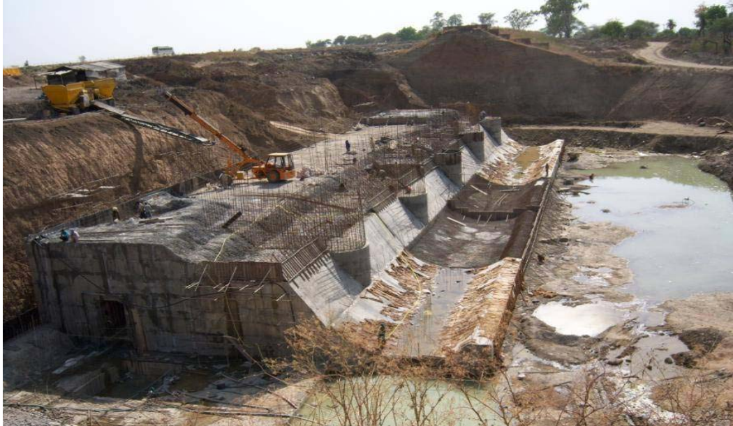
जेएनएनयूआरएम के अंतर्गत इंदौर में निर्माणाधीन यशवंत सागर जल आवर्धन योजना