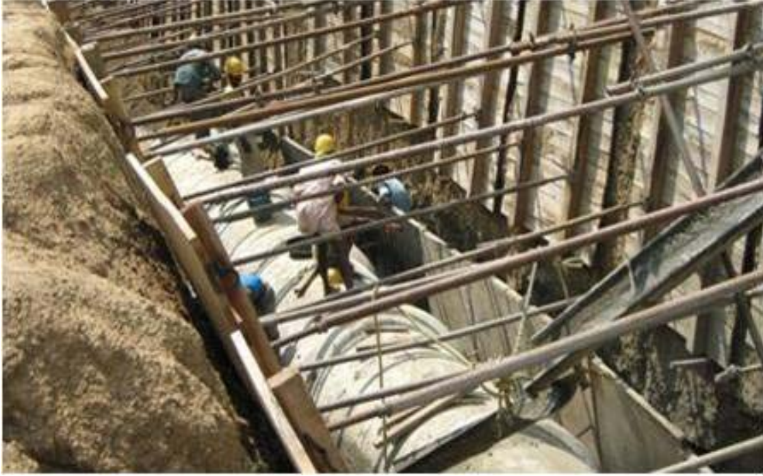
प्रोजेक्ट उदय के अंतर्गत भोपाल में निर्माणाधीन सीवर नेटवर्क