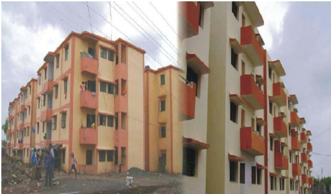
जेएनएनयूआरएम के अंतर्गत श्यामनगर भोपाल में शहरी गरीबों हेतु निर्मित आवास